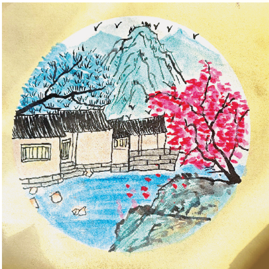
小记者:孙若涵 周口市纺织路小学四(6)班 辅导老师:刘瑞瑞