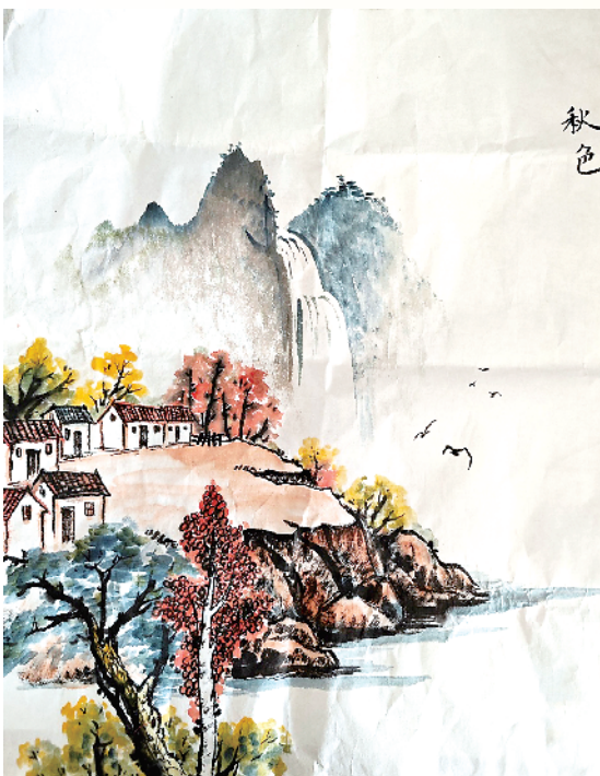
小记者:安怡冉 周口市纺织路小学四(6)班 辅导老师:刘瑞瑞